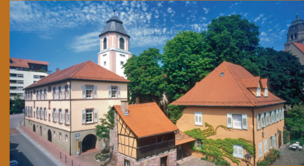
Die Herausgabe der Broschüre wird ermöglicht durch die freundliche Unterstützung des Verkehrsvereins Pforzheim e.V./ „Aktion Heimatliebe“ und dem Kulturamt der Stadt Pforzheim

Wegbeschilderung: Schwarzwaldverein e.V.