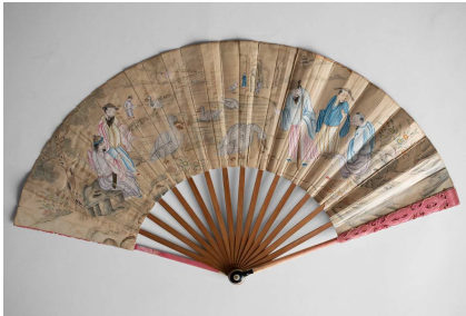
Fächer aus dem Besitz Alexander von Humboldts China, um 1840 Privatbesitz

13. April bis 8. September 2019 | Eröffnung Freitag, 12. April, 19 Uhr Offene Horizonte - Schätze zu Humboldts Reisewegen