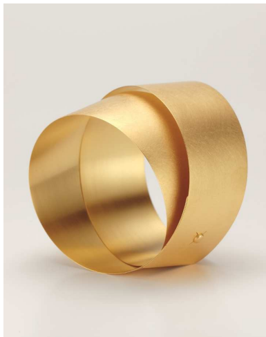
Armreif »TIRA«, Gold Ulla + Martin Kaufmann, 2015

Eintritt 6 €, ermäßigt 3,50 €, Kombiticket mit Dauerausstellung 8,50 €