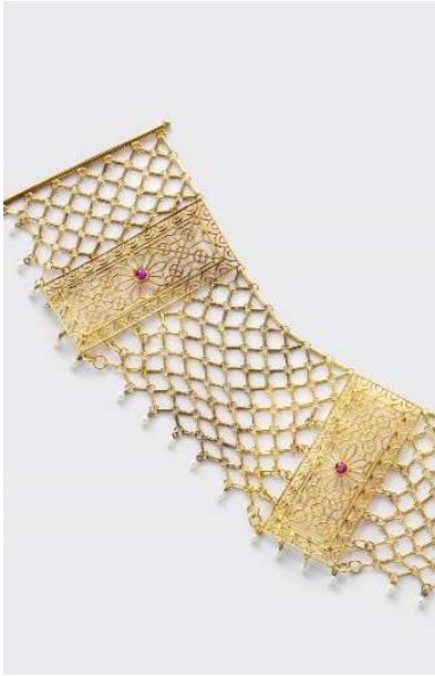
Halsschmuck vermutlich deutsch, um 1820

wohl aus dem Besitz der zweiten Gemahlin Napoleons Marie Louise