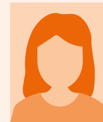
Siddika Senoglu Beratung in Türkisch und Deutsch