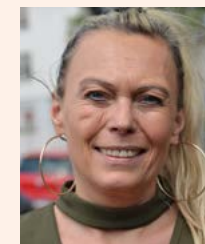
Suzana Pintauer Beratung in Kroatisch