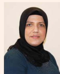
Nutuya Kayak Beratung in Türkisch