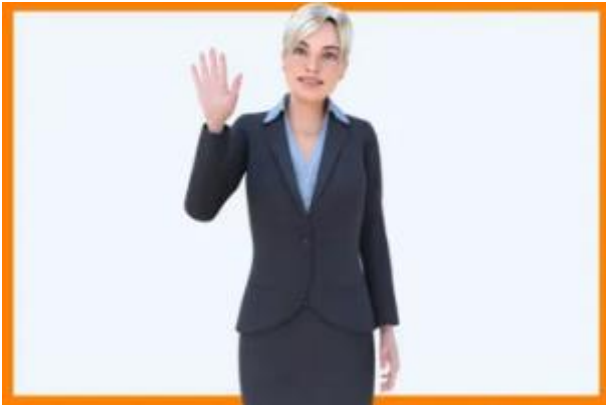
Abbildung 13: Gebärdensprach-Avatar in Aktion

Für gehörlose Menschen ist die Kommunikation mit nicht Betroffenen sehr schwer und eine große Barriere im Alltag. Dank der voranschreitenden Forschung und Entwicklung der Informationstechnologie ist es heute möglich, mithilfe der künstlichen Intelligenz und Motion-Capture (bekannt aus der Filmwelt) einen digitalen Avatar für die Gebärdensprache zu entwickeln. Ein sol-