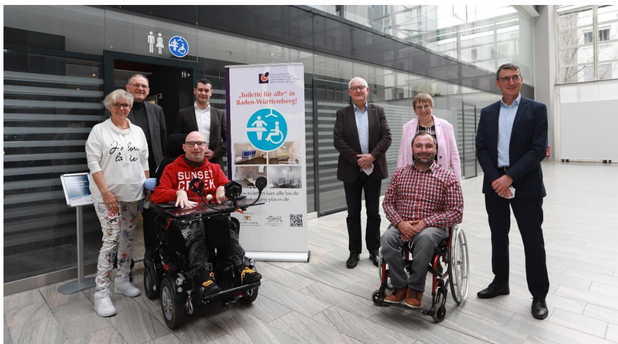
Abbildung 10: Team des Projekts „Toiletten für Alle“

Beim Projekt „Toilette für Alle“ habe ich den Verein Förderung behinderter Menschen Pforzheim-Enzkreis e. V. dabei unterstützen dürfen, eine Toilette zu realisieren, die Menschen mit Behinderung ein Stück Lebensqualität zurückgibt. Die „Toilette für Alle“ ist für Menschen mit komplexer Behinderung konzipiert und ermöglicht Betroffenen mit verschiedenen Ausstattungen eine angemessene und menschenwürdige Teilhabe am öffentlichen Leben.