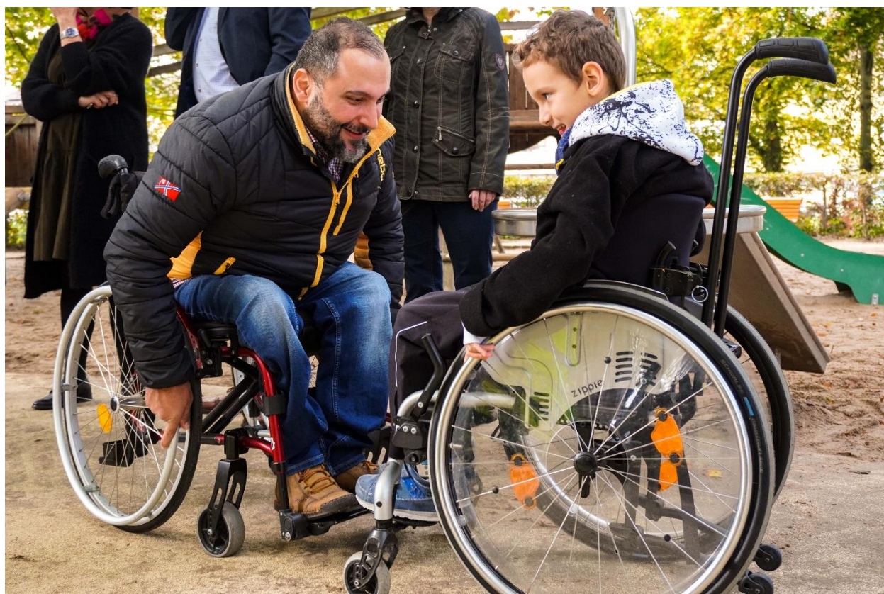
Abbildung 12: Inklusionsspielplatz im Stadtgarten

Inklusion muss früh beginnen. Schon im Kindesalter ist es wichtig, dass Inklusion vermittelt und gelebt wird. Dazu trägt der Inklusionsspielplatz im Stadtgarten bei, bei dessen Eröffnung ich am 12. Oktober dabei sein durfte. Auf diesem Spielplatz können Kinder mit Beeinträchtigungen barrierefrei spielen und in Kontakt mit anderen Kindern kommen, so werden auch Barrieren im Denken und Handeln zwischen den Kindern früh verhindert und abgebaut. Ich setze mich auch weiterhin für eine inklusive Spielplatzlandschaft in Pforzheim ein.