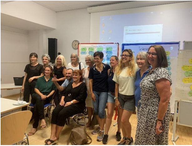
Abbildung 7: Teilnehmer des Workshops

zwei- bis dreimal mehr davon betroffen. Ziel des Workshops war es daher, das Thema in verschiedenen Bereichen zu erfassen, um daraus Verbesserungspotentiale und Handlungsfelder zu erarbeiten.