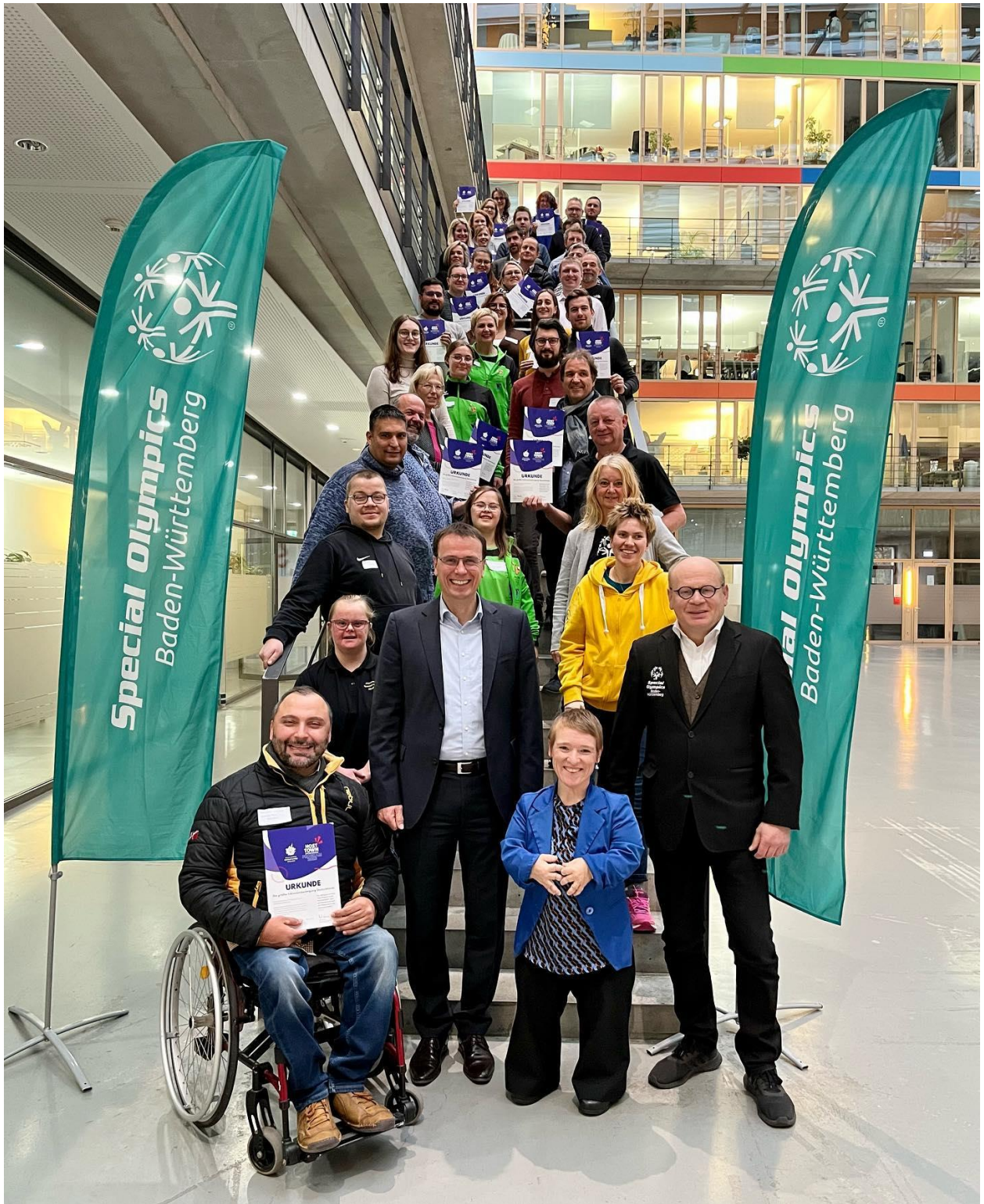
Abbildung 16: Überreichung Urkunde für das Host Town Programm