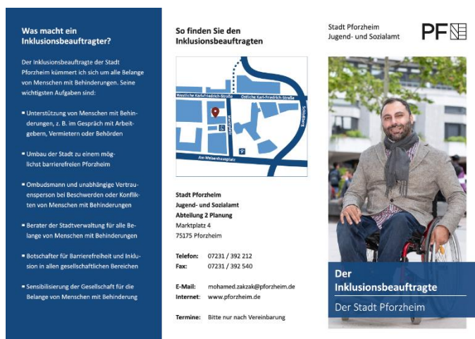
Abbildung 9: Neuer Flyer Inklusionsbeauftragter

Dieses Jahr habe ich den Informationsflyer über meine Funktion als Inklusionsbeauftragter überarbeitet und in einer verbesserten Version für blinde und sehingeschränkte Menschen veröffentlicht. Darin informiere ich über meine Aufgabenfelder und auf welchen Wegen man mich erreichen kann. Dies ist ein weiterer Schritt in Richtung Barrierefreiheit und Inklusion.