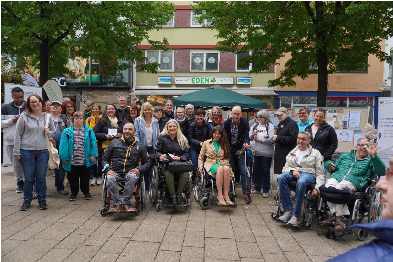
Abbildung 4: Teilnehmer des Aktionsnachmittags

Wie in den letzten Jahren auch, wurde am 5. Mai der „Europäische Protesttag für die Gleichstellung von Menschen mit Behinderung“ begangen. Zusammen mit der ehrenamtlich Beauftragten für die Belange der Menschen mit Behinderung Enzkreis sowie zahlreichen Akteuren veranstalteten wir in der Pforzheimer Fußgängerzone einen Aktionsnachmittag. Das Motto lautete „Tempo machen für Inklusion – barrierefrei zum Ziel!“. Ziel war hier neben der Sensibilisierung der Bürgerinnen und Bürger auch die Privatwirtschaft, welche darauf aufmerksam gemacht wurde, auch einen Beitrag zum Abbau von Barrieren zu leisten. Die selbst betroffene Grünen-Bundestagsabgeordnete Stephanie Aeffner war bei der Aktion auch dabei und unterstützte uns hier tatkräftig.