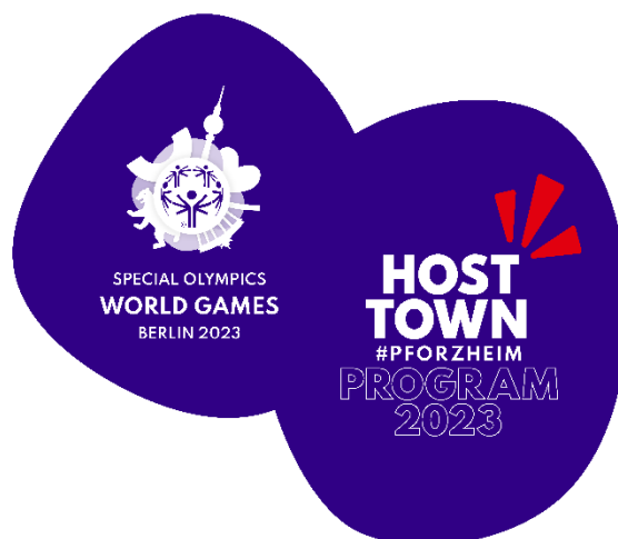
Abbildung 15: Host Town Pforzheim

Anfang 2022 erhielten wir die Nachricht, dass wir zu einer von 216 Host Towns für die „Special Olympics 2023“ in Deutschland ernannt wurden. Damit ist auch Sport als weiterer wichtiger Baustein der Inklusion Teil meiner Arbeit in diesem Jahr gewesen. Im Rahmen der Special Olympics 2023 dürfen wir die vietnamesische Delegation empfangen, die vier Tage lang in Pforzheim verbingt, bevor sie nach Berlin zur den Wettkämpfen fährt. In Vorbereitung auf einen interessanten kulturellen und inklusiven Austausch besuchte ich dieses Jahr mehrere Host Town Workshops und vernetzte mich mit anderen Kommunen, um Vorbereitungen zu treffen. Geplant sind Aktionen, die auch die Bürgerinnen und Bürger miteinbeziehen und somit ein inklusives und interkulturelles Happening bewirken.