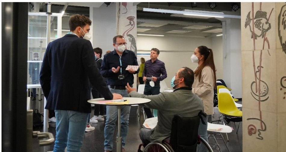
Abbildung 14: Diskussion auf der Zukunftswerkstatt Smart City

verschiedenen Beiräten war auch ich an diesem Workshop beteiligt und habe mich für die Ziele und Belange der Menschen mit Behinderung eingesetzt und meine Ideen mit den Teilnehmern diskutiert. Gerade wenn neue, disruptive Technologien oder gesellschaftliche Veränderungen passieren, ist es wichtig, dass es eine Stimme für diejenigen gibt, die sonst nicht so präsent für die Gesellschaft sind.