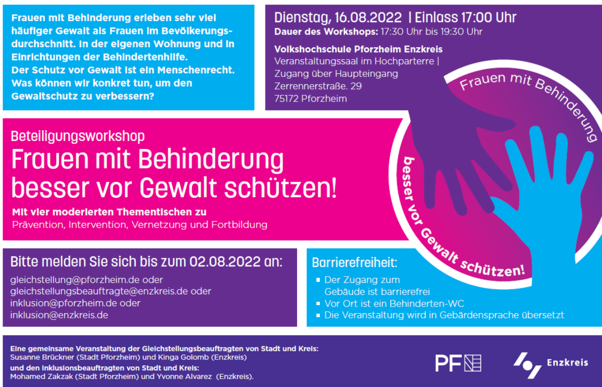
Abbildung 5: Einladung zum Workshop

Ebenfalls fortgesetzt wurde das Projekt „Frauen mit Behinderung besser vor Gewalt schützen“, welches dieses Jahr am 16. August stattfand. Zusammen mit den beiden Gleichstellungsbeauftragten der Stadt Pforzheim und Enzkreis sowie der Inklusionsbeauftragten Enzkreis durften wir zu einem Beteiligungsworkshop in der Volkshochschule Pforzheim einladen. Insgesamt nahmen mehr als 30 Personen an der Veranstaltung teil. Darunter waren Betroffene, Fachkräfte aus Beratungseinrichtungen, Frauenhaus, Einrichtungen der Behindertenhilfe sowie Ehrenamtliche aus diesem Bereich. Moderiert wurde