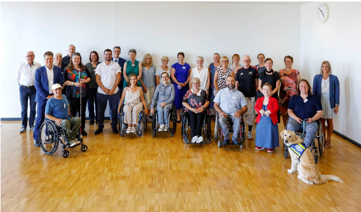
Abbildung 11: Teilnehmer des Landestreffens

Impulse sowie die Möglichkeit, mich stärker mit ihnen zu vernetzen, was mich bei meiner zukünftigen Arbeit unterstützen wird.