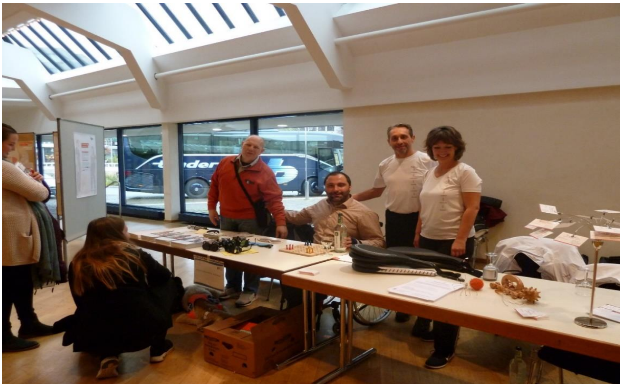
Unser Team beim Gesundheitstag

Der Gesundheitstag verfolgte, wie auch in den letzten Jahren das Ziel, durch viele Informations- und Motivationsquellen sich mit der Gesundheit zu beschäftigen, damit man bewusster mit der Gesundheit umgehen kann. Dieses Ziel wurde am 27.11.2019, wie auch in den letzten Jahren wieder mit vollem Erfolg absolviert.