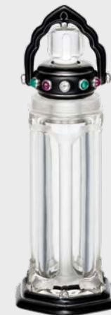
Parfumflakon Cartier Paris, um 1924

We would like to thank the lenders for their generosity.