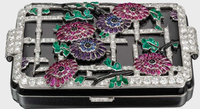
Schminketui »Chrysanthem« Lacloche Frères Ausführung Strauss, Allard & Meyer Paris, um 1928