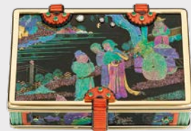
Lack-Etui Cartier Paris, um 1927

Ausstellung im Dialog Samstag, 5. Mai, bis Sonntag, 18. November, montags bis freitags 9 bis 17 Uhr und samstags nach Vereinbarung »Vom Rohstein zum Schmuckobjekt« Schütt – Schmuck & Edelsteine Goldschmiedeschulstraße 6, dem Reuchlinhaus gegenüber www.schuetz-schmuck-edelsteine.de Telefon 07231/22 00 1