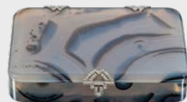
Achat-Etui Frankreich (?), um 1919