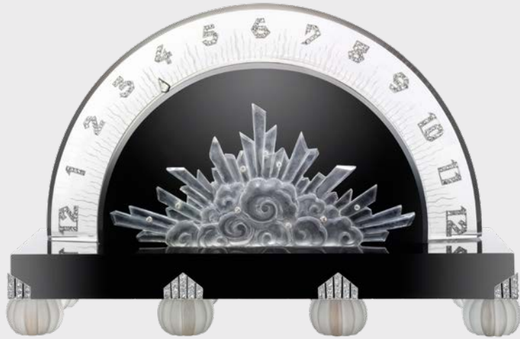
Retrogade Tischuhr »Wolke« Verger Frères Uhrwerk Vacheron Constantin Paris, 1927

One striking example is the »Panther« vanity case created by Cartier in 1925, displaying a panther against a backdrop of cypresses, the most prevalent trees in Persian miniature landscapes, and crafted from enamel, mother-of-pearl, rubies, turquoise, onyx and diamonds. The panther might have also been inspired by the drawings of Paul Jouve, who had illustrated Rudyard Kipling's Jungle Book. Compared to jewellery, vanity and other kinds of cases provided larger surfaces to accommodate reinterpretations of such exotic motifs. This masterpiece was showcased at the International Exhibition of Modern Decorative and Industrial Arts in Paris in 1925. In addition to cigarette and vanity cases, the Aga Khan Collection also comprises timepieces that incorporate masterfully crafted movements in exquisitely extravagant cases.