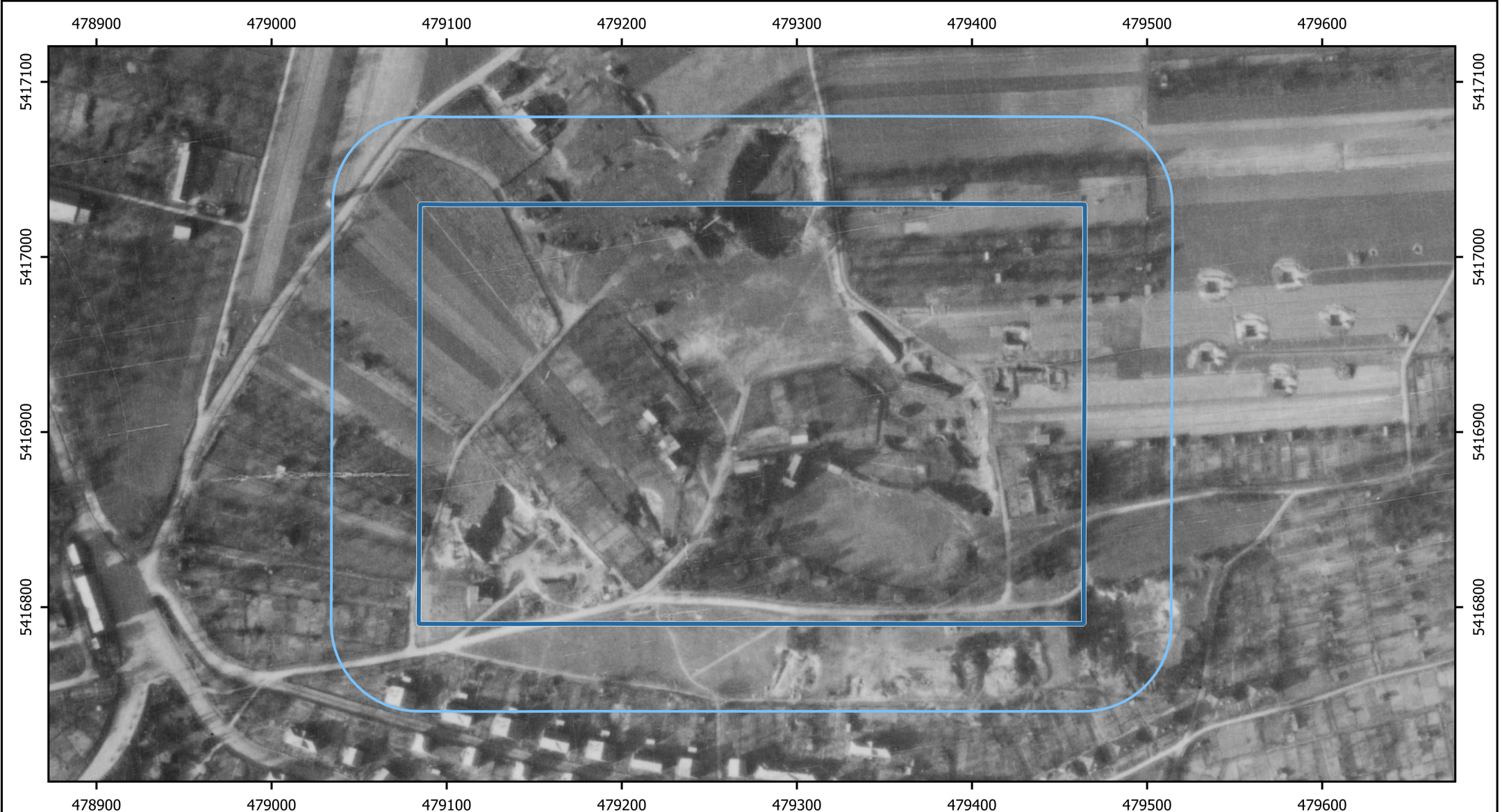
Ausschnittvergrößerung eines Luftbilds vom 18.03.1945.

Maßstab 1 : 3000 – Originalgröße DIN A3 Koordinatenreferenzsystem: ETRS89 UTM 32N