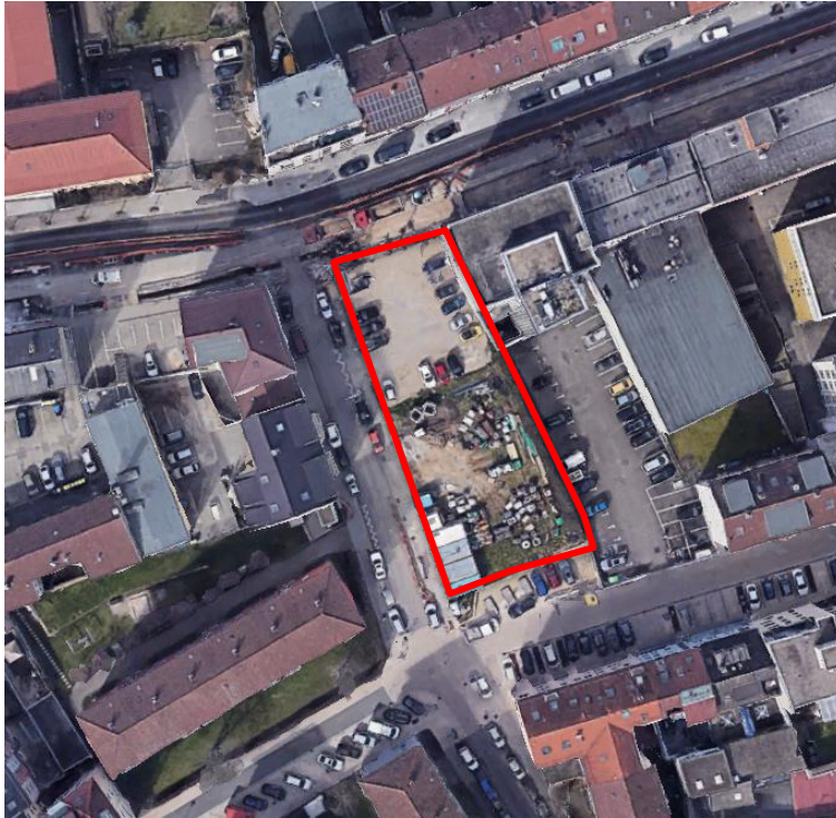
Abb.: Luftbild