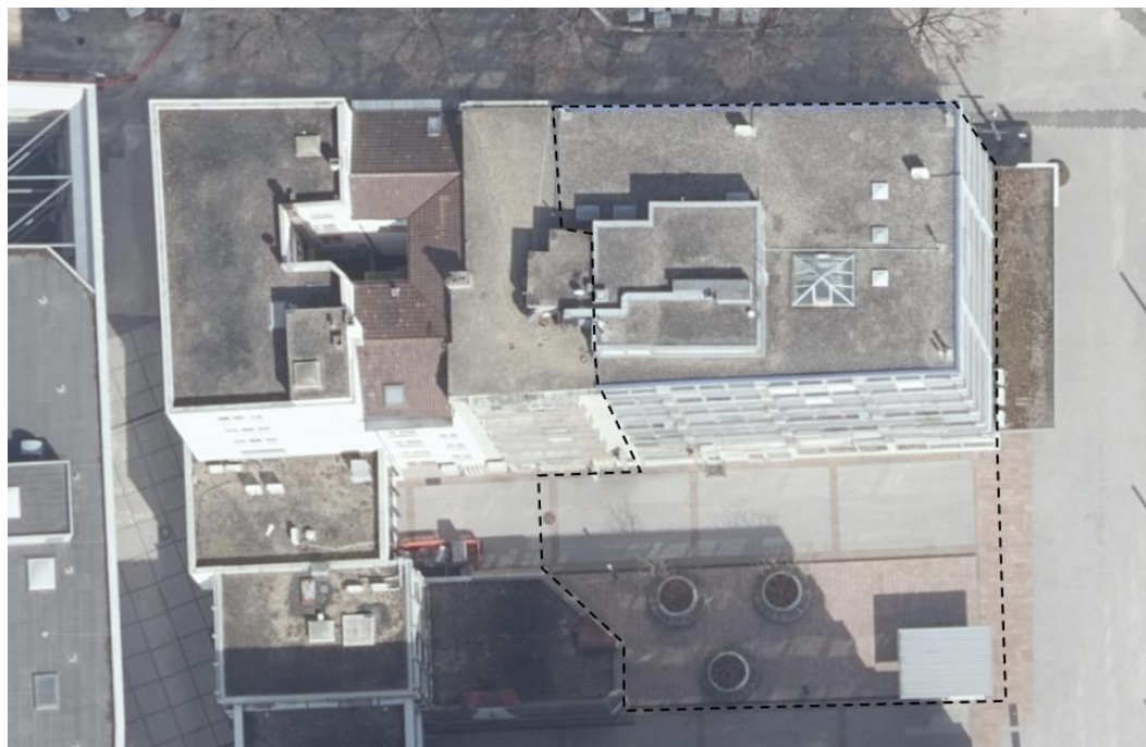
Abbildung 2: Luftbild des aktuellen Zustands mit Markierung des Geltungsbereichs

Der Landschaftsplan des Nachbarschaftsverbandes Pforzheim enthält für den Bereich des Bebauungsplans keine Darstellungen.